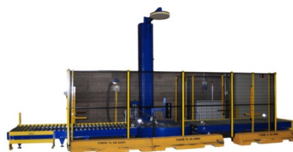
LINEE COMPLETE PER LA GESTIONE PALLET